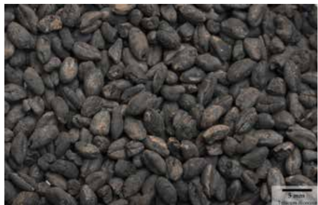
› Abbildung 3: Emmer ( Triticum dicoccum ) aus der frühen Jungsteinzeit (Bandkeramische Kultur).

Mit dem Beginn der Jungsteinzeit fing der Mensch schließlich an, seine Nahrung selbst zu produzieren, was die Domestikation von Pflanzen und Tieren voraussetzt. Dieser länger andauernde Prozess, bei dem der Mensch die Eigenschaften spezifischer Arten bewusst oder unbewusst verändert, vollzog sich in verschiedenen Regionen der Welt zu unterschiedlichen Zeiten und auf Basis unterschiedlicher Arten – wobei es sich bei den domestizierten Pflanzen zumeist um ein Bündel aus Kohlenhydrat-, Eiweiß- und Fett-liefernden Arten handelte. Durch die Domestikation von Pflanzen und Tieren wurde die Ernährung des Menschen ein Stück weit unabhängig von der Natur. Zugleich griff der Mensch durch die nun einsetzende Landwirtschaft verstärkt in diese Natur ein. Für die europäische Jungsteinzeit ist das Erstdomestikationszentrum in Südwestasien von Bedeutung, vor allem die Gebiete der heutigen Osttürkei und des westlichen Irans. Hier wurden vor ca. 10.500 Jahren heimische wilde Spelzgetreide (Emmer, Einkorn und Gerste, aus denen sich im Lauf der Zeit dann auch unbespelzte Arten entwickelten), Hülsenfrüchte (Erbsen, Linse, Linsenwicke, Kichererbsen) und eine Öl- bzw. Faserpflanze (Lein) domestiziert. Etwa 1000 Jahre später folgte die Domestikation unserer heutigen Nutztiere Rind ( Bos taurus ), Schaf ( Ovis aries ), Ziege ( Capra hircus ) und Schwein ( Sus domesticus ).