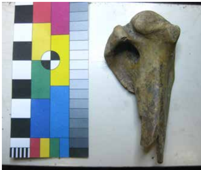
› Abbildung 1: Schnittspuren an einem Gänseknochen.

Mit dem Aufkommen von Speeren nutzte vermutlich schon Homo erectus als erste Menschenart Distanzwaffen für die Jagd auf Großwild, wie Überreste von Nashörnern und Elefanten unter den erbeuteten Tieren im Fundplatz Bilzingsleben in Thüringen belegen [6]. Dabei setzt die Jagd auf Großwild auch die Fähigkeit voraus, die anfallenden großen Mengen an Fleisch durch Trocknung oder Räuchern zu konservieren. Mit dem Be-