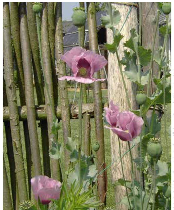
› Abbildung 4: Schlafmohn ( Papaver somniferum ).

Für den Kulturpflanzenanbau des späten 6. und des 5. Jahrtausends vor unserer Zeitrechnung wird eine „intensive Gartenbewirtschaftung“ postuliert, also eine arbeitsintensive Kultivierung (mit sorgfältiger Bodenbearbeitung, Dibbeln oder Reihensaat, Handjäten oder Hacken, Düngung zur Erhaltung einer hohen Bodenfruchtbarkeit und Bewässerung) auf festen Parzellen in Sied-