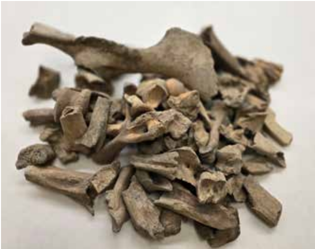
› Abbildung 2: Faunenreste